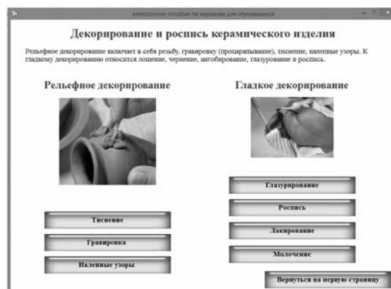
Рис. 2. Тема «Декорирование и роспись керамического изделия»