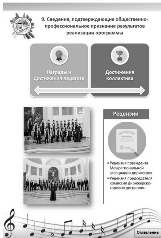
Рис. 2. Страницы методического кейса «Петербургский камертон»

учреждений дополнительного образования детей и отделений дополнительного образования детей для его совершенствования и оптимизации. Важно отметить, что модель методического кейса может быть использована не только в дополнительных общеобразовательных общеразвивающих программах любой направленности в системе дополнительного образования детей, но и на других уровнях образования.