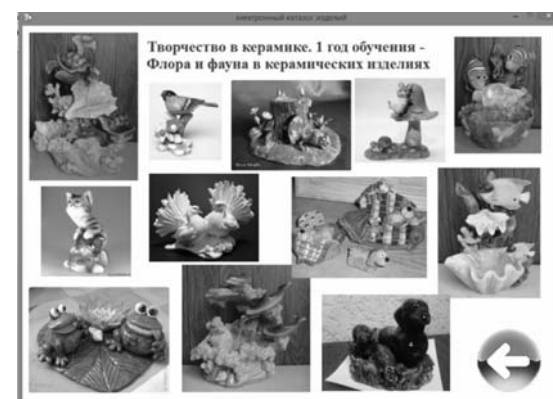
Рис. 4. Страница с картинками идей для работы