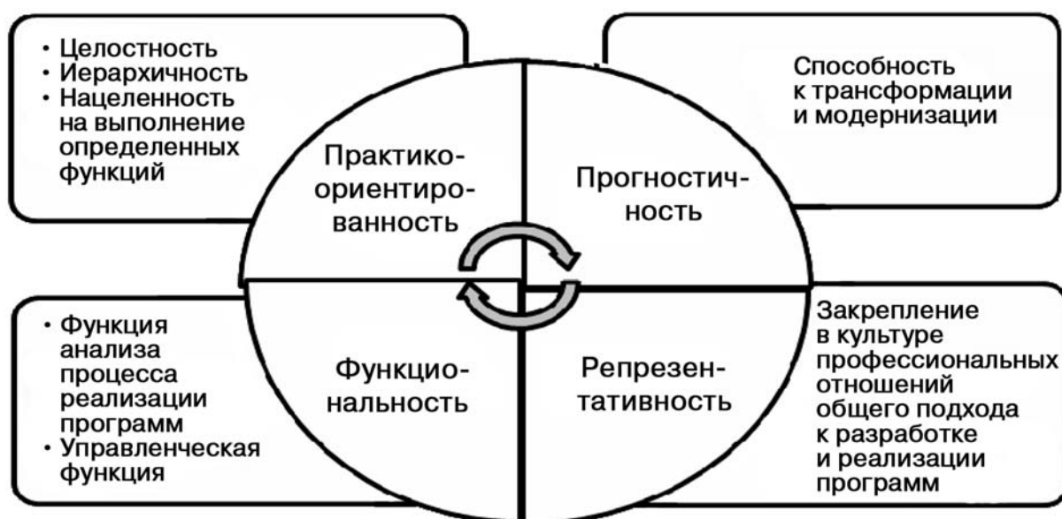
Рис. 2. Критерии эффективности и результативности методического конструкта

Эффективность реализации управленческой функции конструкта опосредованно подтверждается