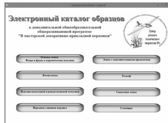
Рис. 3. Темы электронного пособия «Электронный каталог образцов»