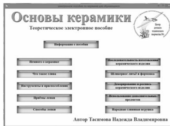
Рис. 1. Темы электронного пособия «Основы керамики»