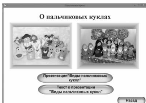
Рис. 6. Страница с материалами для проведения занятия

Использование электронных образовательных ресурсов в учебном процессе – это попытка предложить один из путей, позволяющих интенсифицировать учебный процесс, оптимизировать его, поднять интерес обучающихся к изучению предмета, реализовать идеи развивающего обучения, повысить темп, увеличить объём самостоятельной работы.