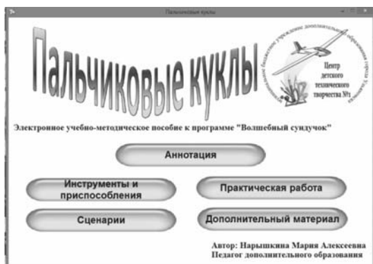
Рис. 5. Стартовая страница электронного пособия «Пальчиковые куклы»